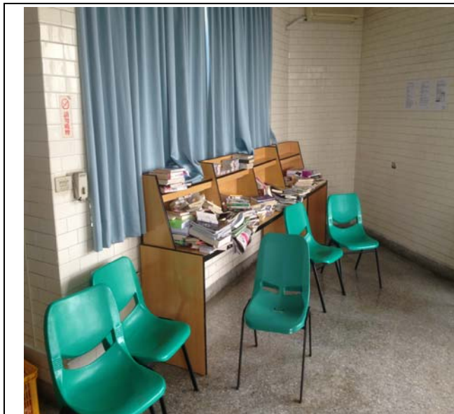
漫畫書被隨意亂放

說明:因暑期營隊之同學,經常使用交誼廳後發生不整理或隨意打開房門的狀況發生,提請討論。