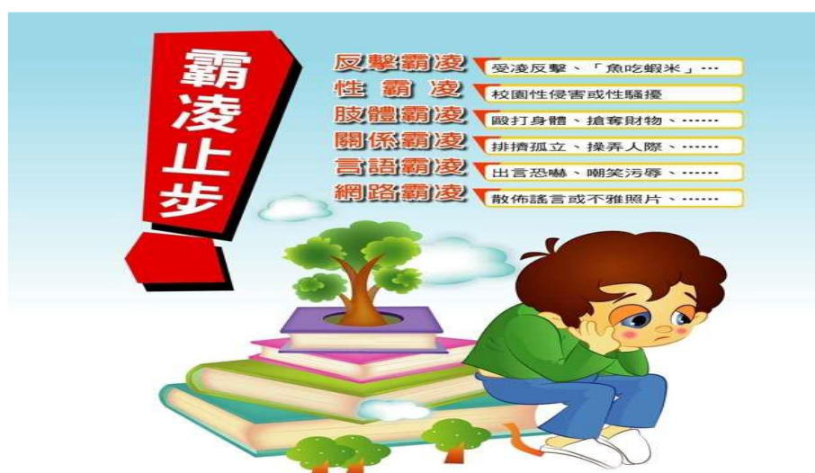
常見校園霸凌樣態